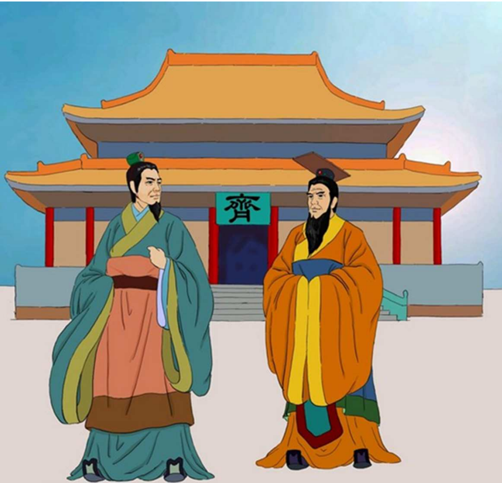
Guan Zhong, filosofo e politico cinese, primo ministro 685 a. C.